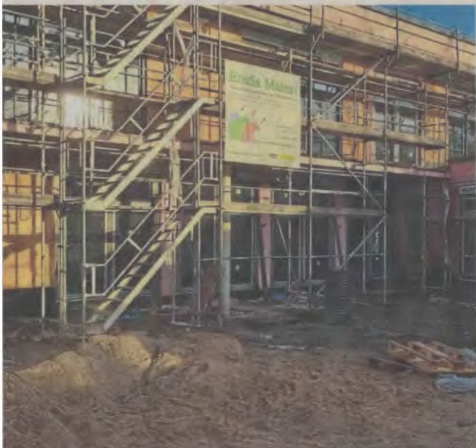
Die Kita am Stadion soll im Juni fertiggestellt sein. Die Außenarbeiten wurden im vergangenen Jahr abgeschlossen.