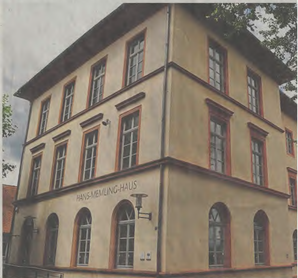
Warum die Entwicklung des Hans-Memling-Hauses (Foto) und das Bürgerhaus Riesen zu gehören, erschließt sich den Oppositionsfraktionen nicht.