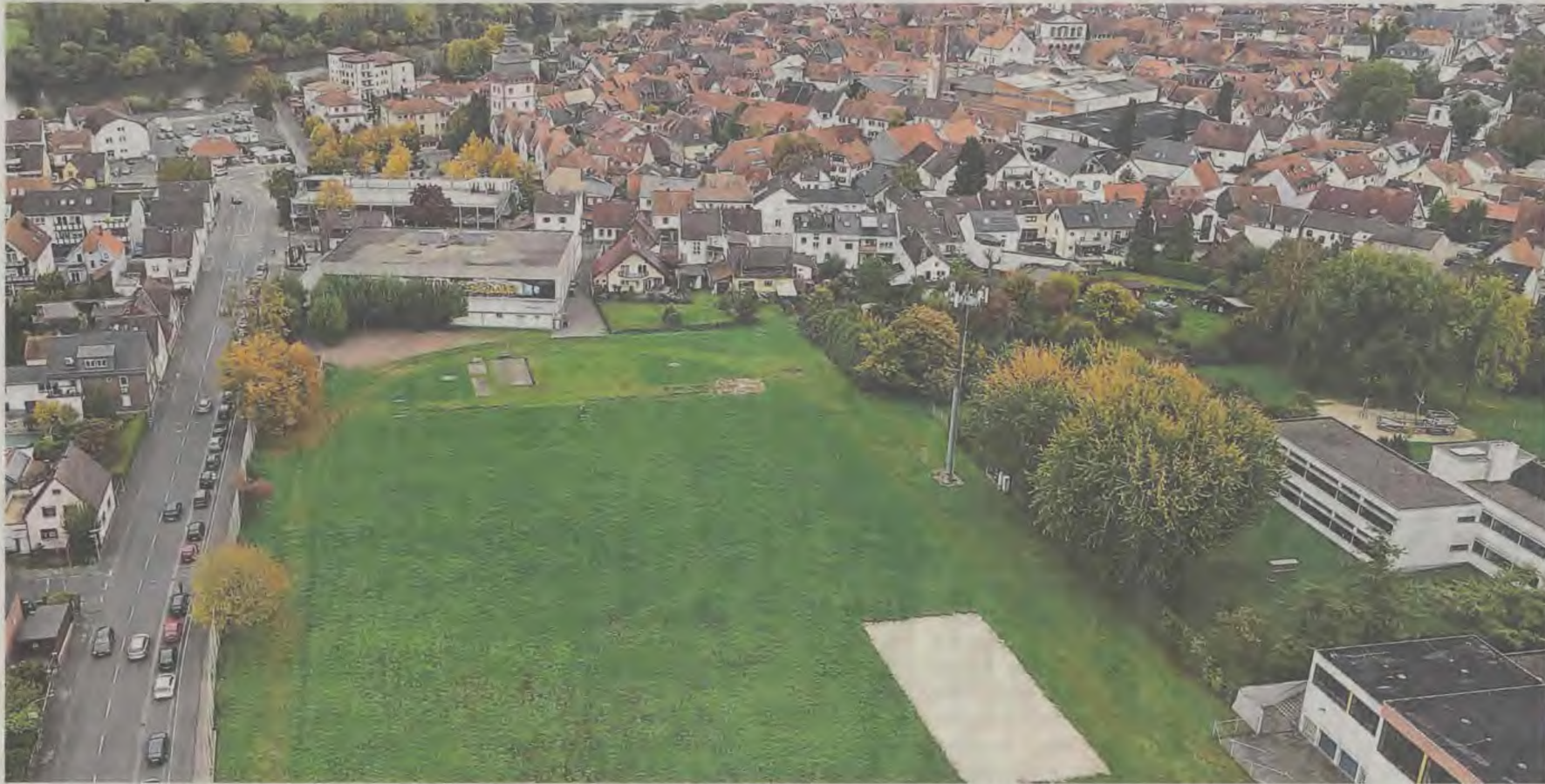
Ein Bebauungsplan für das Gelände am Jahnsportplatz ist seit 2023 in Arbeit. Jetzt könnten Investoren neue Ideen hervorbringen.