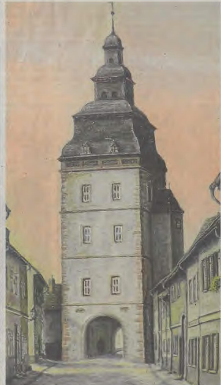
REINHOLD GRIES Steinheimer Torturm, Ölgemälde von 1922.