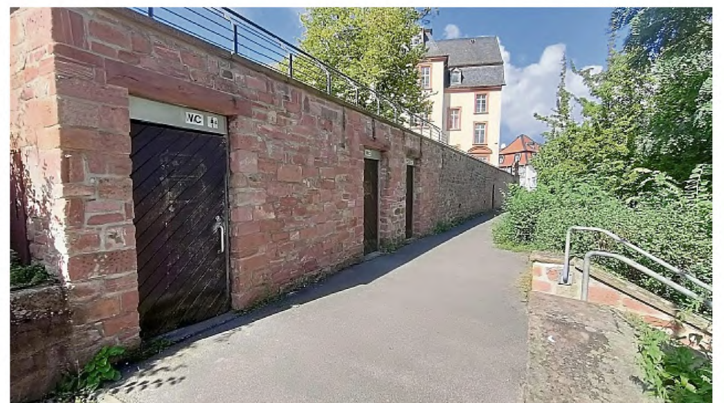
Für 220000 Euro sollen die überwiegend kaputten Toiletten unterhalb des ehemaligen Bubenschulhofs modernisiert werden.