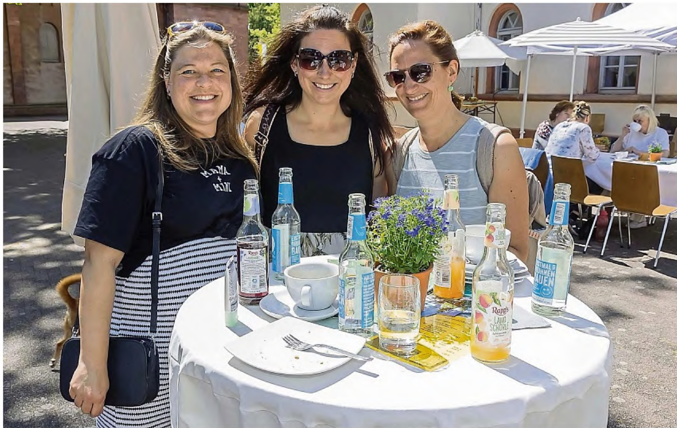
Der Hof vor dem Haus wird gerne für Feiern benutzt. So auch am kommenden Dienstag.