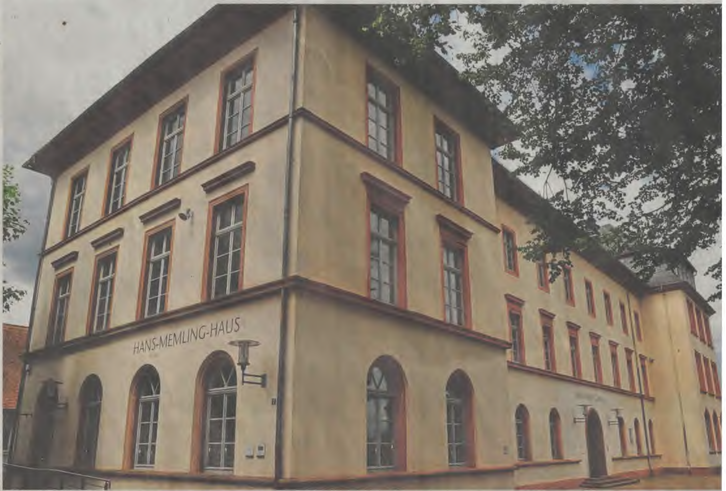
Warum die Entwicklung des Hans-Memling-Hauses (Foto) und das Bürgerhaus Riesen zu den Projekten im Koalitionsantrag gehören, erschließt sich den Oppositionsfraktionen nicht.