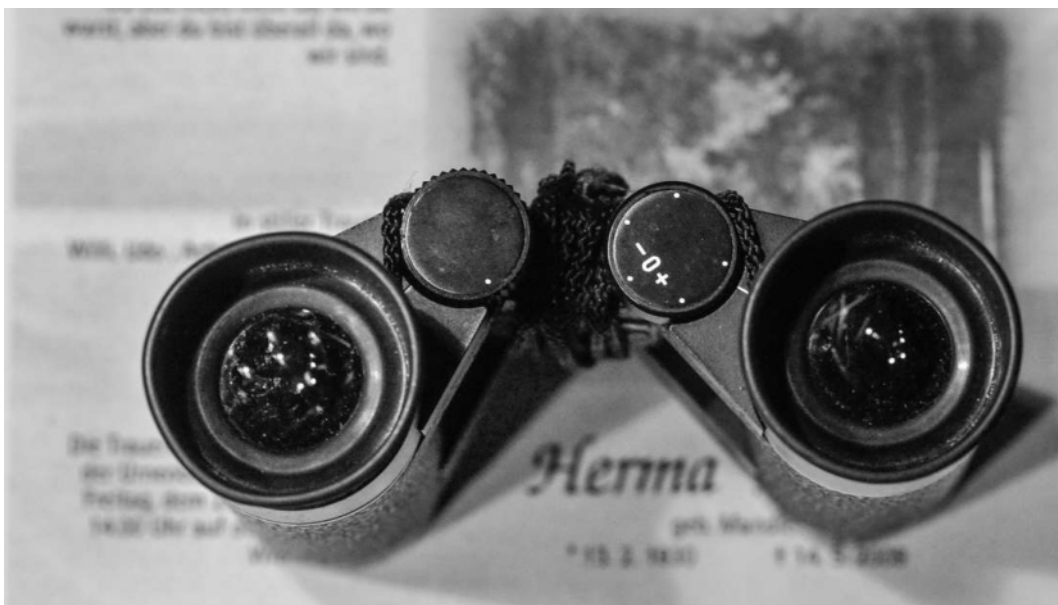
Nicht immer sind die trauernden Männer selbst auf den Fotos zu sehen. Gegenstände stellen stattdessen Erinnerungen oder bestimmte Situationen dar.