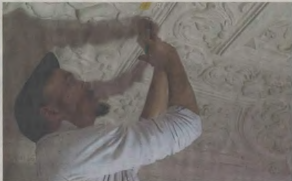
Im Obergeschoss des Einhardhauses haben Experten die historische Stuckdecke aus dem Jahr 1615 restauriert.