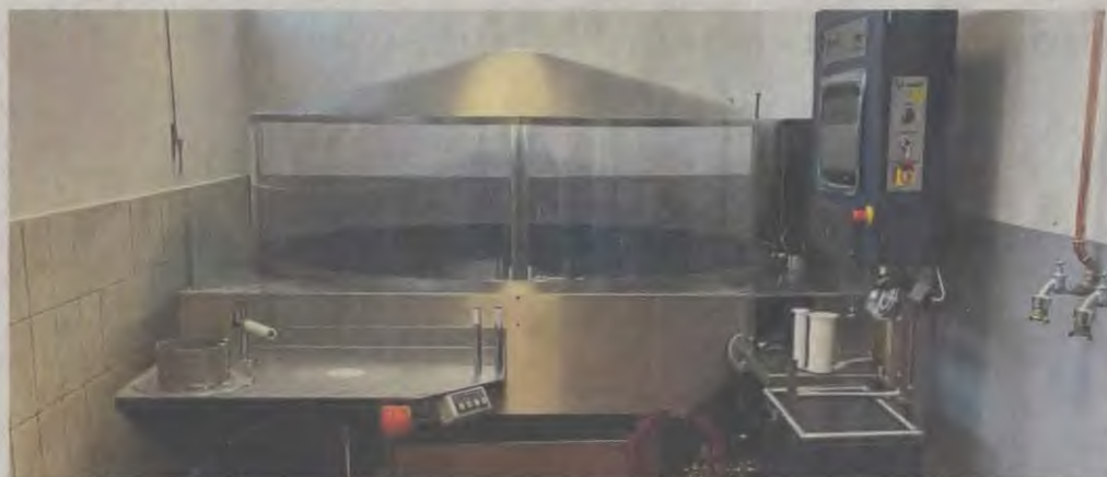
Die Feuerwehr Seligenstadt hat eine umweltfreundliche und energieeffiziente Schlauchwasch- und Pflegeanlage erhalten.

In Zusammenarbeit zwischen Hochbau- und Landesdenkmalamt wurde die Renovierung des Obergeschosses des Einhardhauses angegangen. Die Decke des geschichtsträchtigen Gebäudes am Marktplatz stammt aus dem Jahr 1615 und besteht aus kunstvoll verarbeiteten Stuck – eine Arbeit des Badenhäuser Meisters Eberhard Fischer. Diese wurde im Zuge der Renovierung mit großer