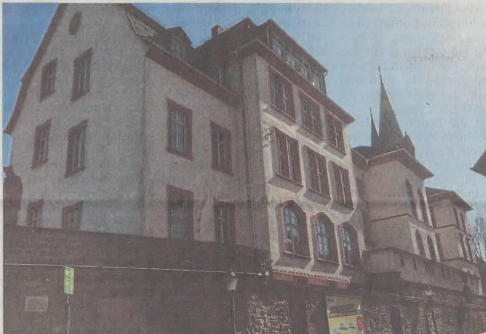
Licht und Schatten an der ehemaligen Seligenstädter Hans-Memling-Schule

Die SPD-Fraktion begrüßt, dass die Seligenstädter sich so deutlich für eine öffentli-