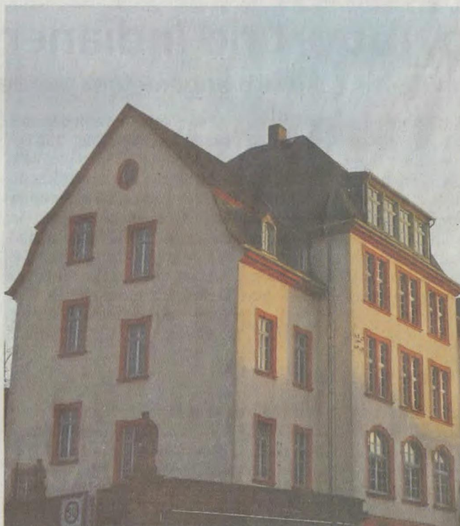
Wie weiter beim HMS-Gebäude: Erasmus-Bildungszentrum (Meinung links) oder Begegnungsstätte (rechts)?