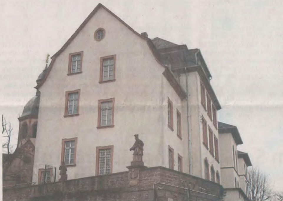
Gebäude der früheren Hans-Memling-Schule: Magistrat und Freundeverein verhandeln über die Umwandlung in ein Bildungs- und Kulturhaus.

Die fünf Fraktionen einigten sich in der Zeit zwischen Bürgervotum, Pandemie-Shutdown und Ausschussrunde auf einen interfraktionellen Antrag, der dem mehrheitlichen Bürgerwillen auf Einrichtung eines Bildungs- und Kulturhauses Rechnung trägt. Gleichzeitig löst das Plenum ein Versprechen ein: die getreuliche Umsetzung der Siegervariante bei der Bürgerbefragung.