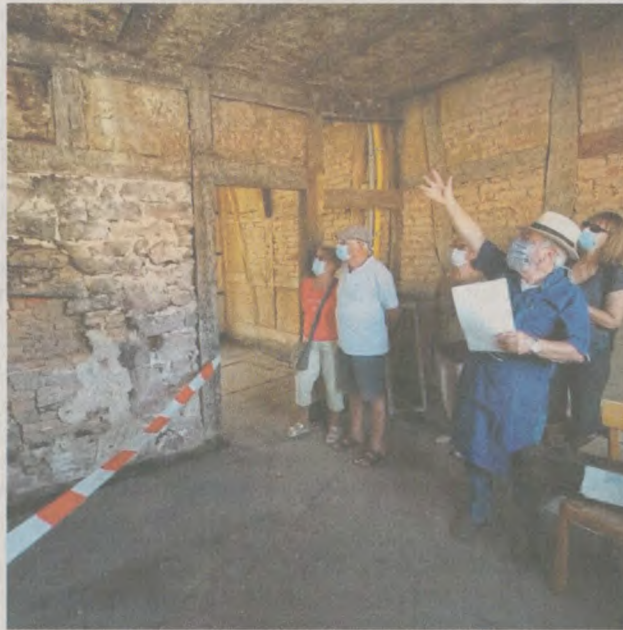
Fachwerkhaus-Sanierung an der Aschaffenburger Straße