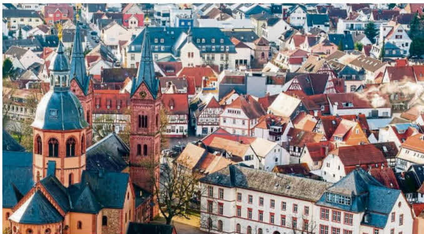
Wie ein einziges Denkmal präsentiert sich die Seligenstädter Altstadt aus der Vogelperspektive.

Draußen vor der Tür ist an Speisen und Getränken gedacht. Mittags sind ganz bo-