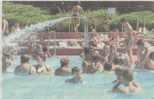
Ein dickes Fragezeichen steht hinter dem Schwimmbad. Womöglich fällt die gesamte Saison aus.

diese überhaupt noch bezahlen können. Bis es endgültig Klarheit gibt, wird es aber sicher dauern.