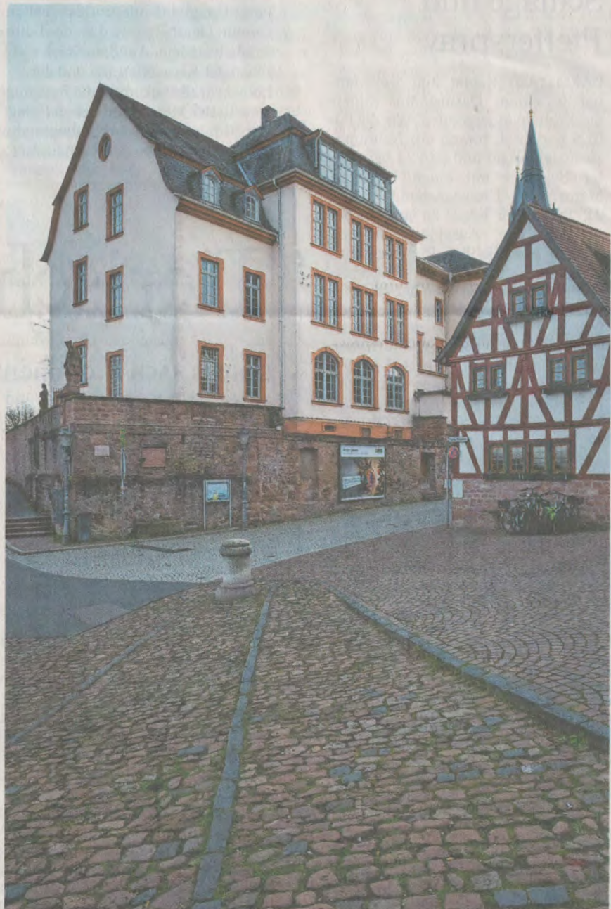
Ein Platz für Kultur: Die Hans-Memling-Schule in Seligenstadt