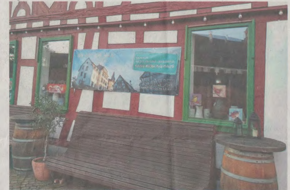
Hans-Memling-Schul-Plakat in der Seligenstädter Altstadt: Ein Antrag auf behördliche Genehmigung wurde erst zum Rosenmontag gestellt, so die Stadtspitze.

Von den HMS-Freunden, klagt Bastian, kämen immer wieder Vorwürfe, das auf der städtischen Internetseite veröffentlichte Gutachten des Planungsbüros Knapp/Kubitza, seit fast einem Jahr öffentlich zugänglich, sei nicht neutral beziehungsweise von der Rathauspitze bewusst gelenkt worden. „Das sind ungeheuerliche Vorwürfe, die in der Bereich der üblen Nachrede gehen und ein renommiertes Planungsbüro sowie die städtische Verwaltung mit dem Ziel verun-