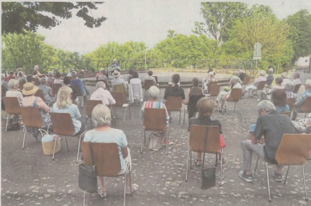
Für Veranstaltungen wie die Lesung des Kunstforums – und nicht nur für die – ist der Schulhof der ehemaligen Hans-Memling-Schule im Sommer ein idealer Platz und bietet viel Raum für zahlreiche Besucher.