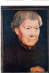
Hans Memling, Porträt eines alten Mannes

Museen der Welt. Geboren wurde er um 1435 in Seligenstadt. Man nimmt an, dass sein Vater Hamman Memlingen aus Mönningen im Odenwald nach Seligenstadt kam und eine Tochter der Familie Stern heiratete. Da das Haus zum Stern am Marktplatz im Torbogen ein auf 1444 datiertes Wappen trägt, vertreten manche die Auffassung, dies könne sein Geburtshaus sein. Vermutlich verbrachte