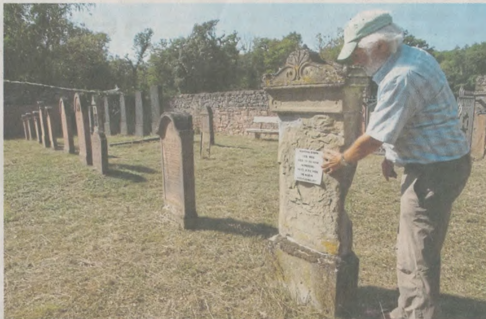
Der AK Ehemalige Synagoge führte durch den jüdischen Friedhof in Klein-Krotzenburg