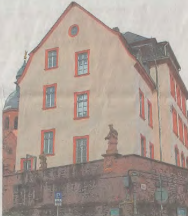
Die Bürger haben vom 16. bis zum 30. März Zeit, um für ihr HMS-Nutzungskonzept zu stimmen.

Die Bürgerbefragung umfasst den Zeitraum vom Montag, 16. März, bis Montag, 30. März, 10 Uhr. Alle Wahlberechtigten (Volljährige mit Wohnsitz in Seligenstadt, deutsche Staatsbürger sowie