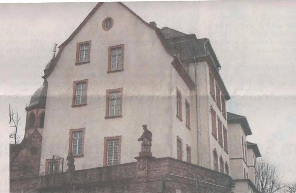
Gebäude der früheren Hans-Memling-Schule: Magistrat und Freundeverein verhandeln über die Umwandlung in ein Bildungs- und Kulturhaus.