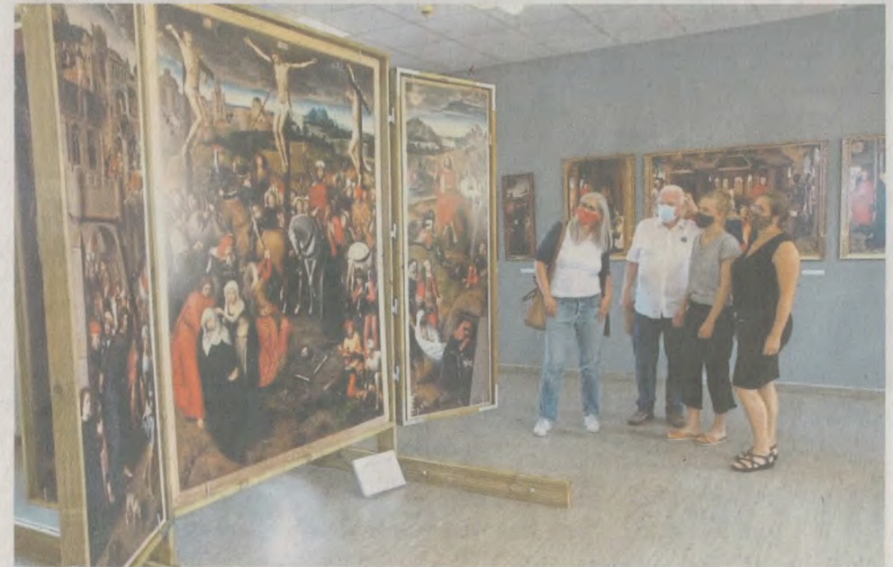
Attraktion Grevenrade-Altar im früheren Hans-Memling-Schulgebäude.