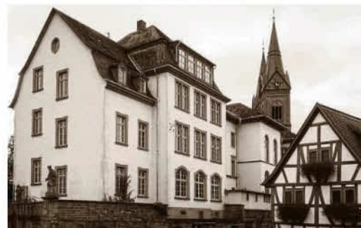
Die frühere Hans-Memling-Schule durch die Linse der Fotofreunde

Ab 14 Uhr steht der Rock-Pop-Jazz-Chor Chormatics aus Seligenstadt auf der EVO-Bühne, ein jung geliebtes