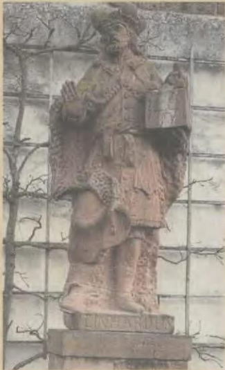
Einhard „wacht“ über die Stadt.