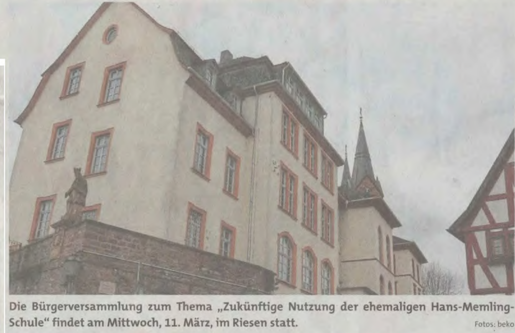
Die Bürgerversammlung zum Thema „Zukünftige Nutzung der ehemaligen Hans-Memling-Schule“ findet am Mittwoch, 11. März, im Riesen statt.

auf der Homepage der Stadt Seligenstadt unter www.seligenstadt.de/aktuelles/hans-memling-schule/ .