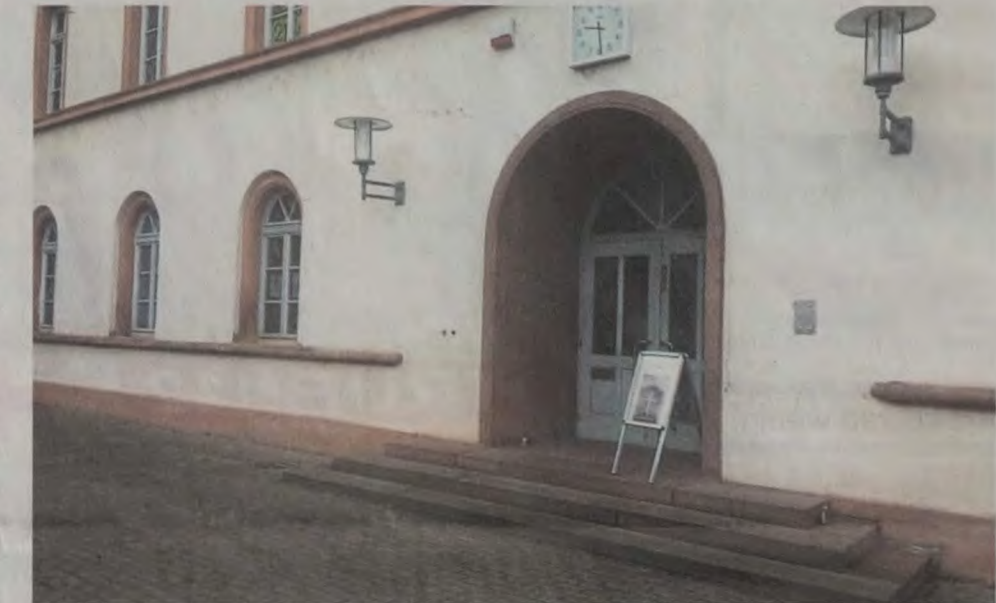
Hereinspaziert ins Hans-Memling-Haus – möglichst schon im Frühsommer!