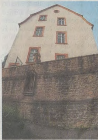
HMS-Gebäude: Was soll draus werden?

Bastian: Hygiene-Abstand im Rathaus nicht gegeben / Hohe postalische Beteiligung