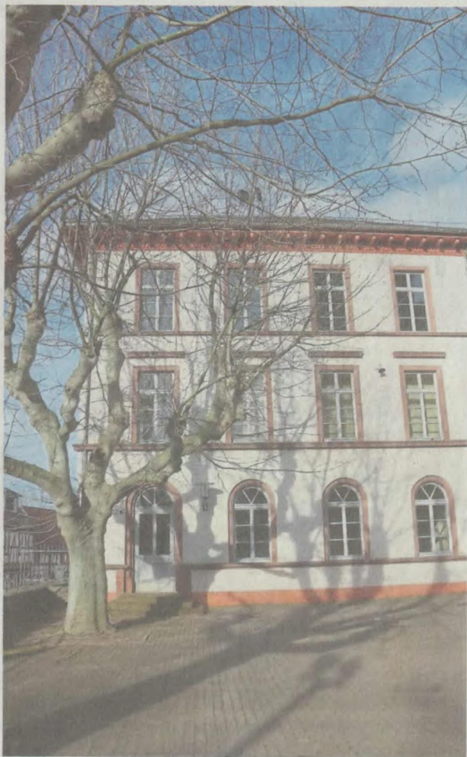
Weit vor dem Beginn der Bürgerbefragung bereits heftig in der Diskussion: Die Nutzung der ehemaligen Hans-Memling-Schule.

Bürgermeister spricht von Falschmeldungen