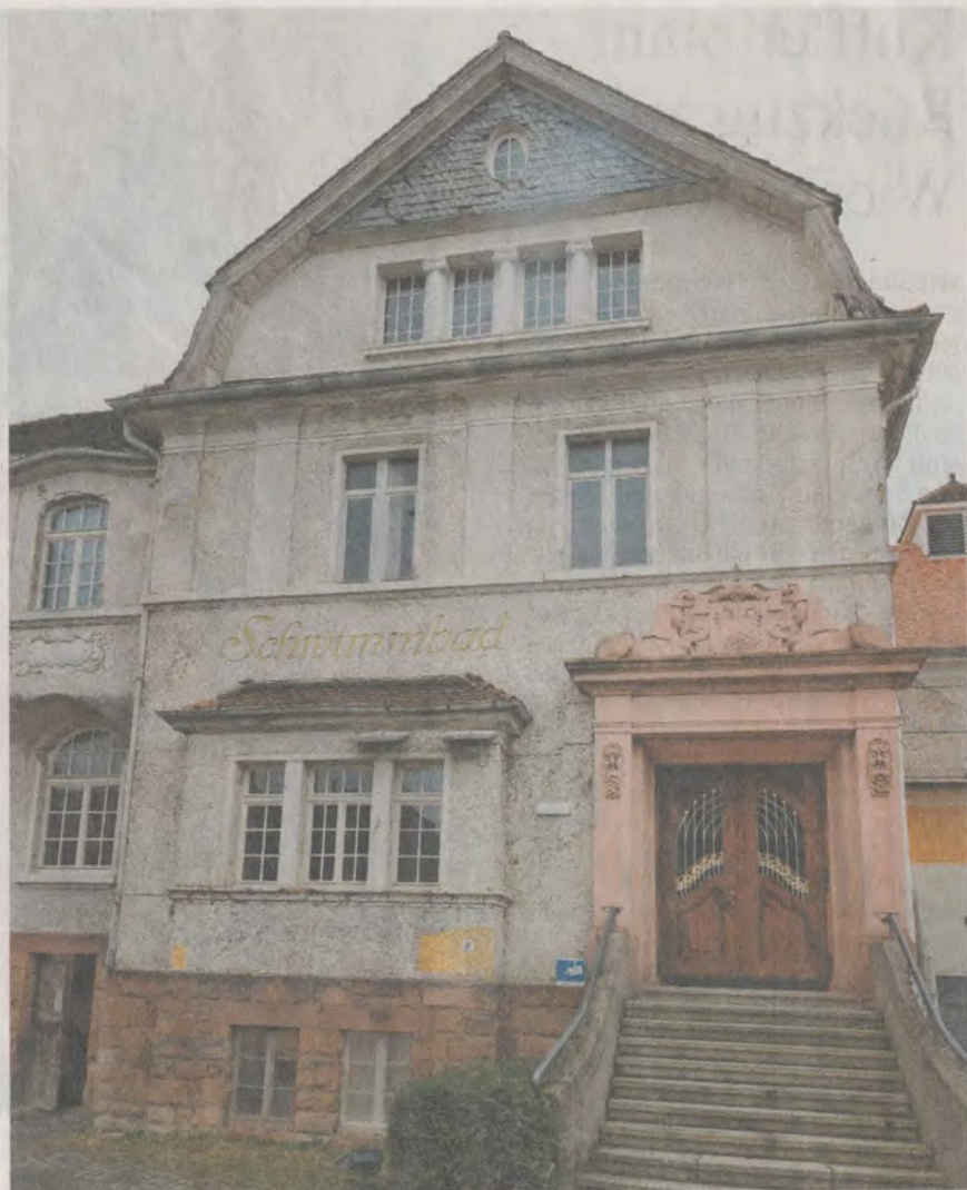
Noch immer Baustelle: Das Theater Altes Hallenbad in Friedberg