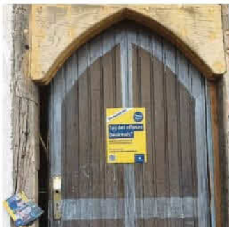
Hereinspaziert ins Fachwerkhäusl!