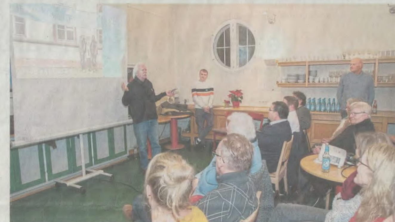
Info-Veranstaltung der HMS-Freunde: Zustimmung und Solidaritätsbekundungen.

Auf großes Interesse stießen die Erläuterungen der Vereinsvertreter zur generationenübergreifenden Nutzung. „Durch variable, also flexible Nutzung der Räume ist eine hohe Auslastung gewährleistet, womit die Betriebskosten voll gedeckt werden können“, fassten sie