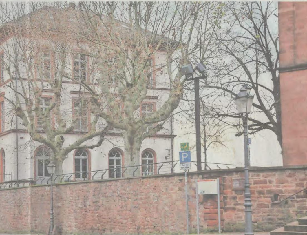
Oben: die ehemalige Hans-Memling-Schule am Seligenstädter Mainufer.

Neue Nutzung der Hans-Memling-Schule – Kulturzentrum, Privatschule oder Kombination denkbar