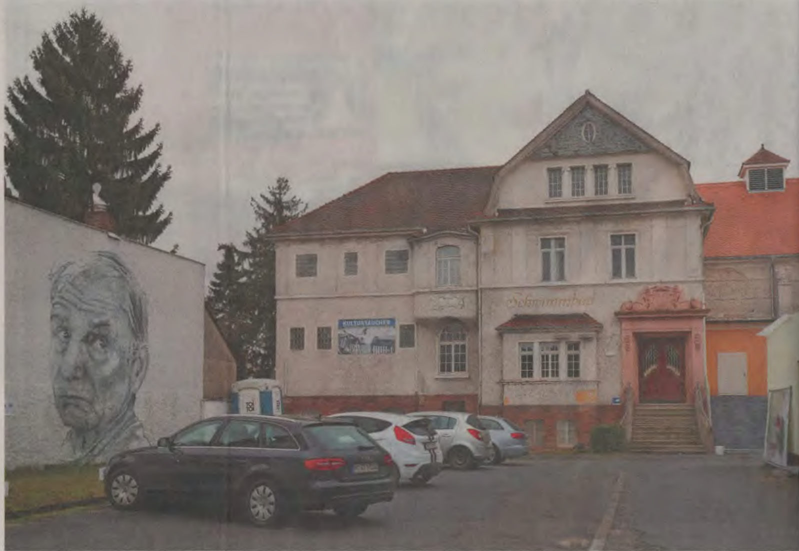
Theater statt Freischwimmer: Auch die Fassade des Alten Hallenbads in Friedberg, das inzwischen eine Kulturstätte ist, soll saniert werden.

Der Beschluss der politischen Gremien zur Teilnahme an dem Bundesprogramm, der am Ende mehrheitlich gefasst wurde, hatte zuletzt noch einmal für Diskussionen gesorgt. Dabei ging es vor allem darum, wer für zusätzlich benötigtes Geld aufkommt, sollte der Kostenrahmen überschritten werden. Weil der Bund das nicht übernimmt, wäre die Stadt als Antragstellerin in der Verantwortung. Das beunruhigte Verwaltung und Stadtverordnete, weil die Stadt in den nächsten Jahren noch für eine Reihe von Projekten eine Menge Geld benötigen muss, insbesondere für