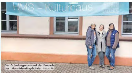
Der Gründungsvorstand der Freunde der Hans-Memling-Schule.

BürgerInnen mit eingebunden. Auch eine Kita wurde in diesem Findungsprozess eingehend erörtert, aber aus guten Gründen nicht weiter berücksichtigt; eine Kita-Einzelzählung schliesst Bürger aus. Die Verkehrsproblematik scheint unzumutbar; Stichwort Elterntaxi; fehlende Genehmigungssicherheit z.B. wegen angrenzender Bundesstrasserstrasse und baulichen Auflagen. Die Außenfläche reicht nicht aus, sogar der öffentliche Spielplatz und weitere Flächen müsste mit einbezogen werden. Die Umbaukosten wären höher als bei einem Neubau.