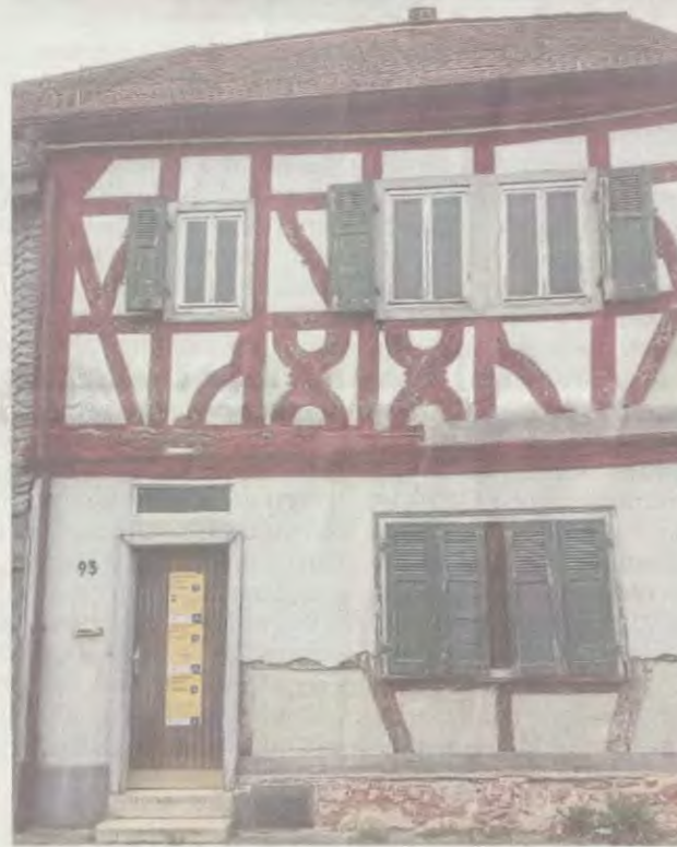
Fachwerksanierung Aschaffenburger Straße 93

Der Verein Lebenswerte Seligenstädter Altstadt führt durch die Oberstadt , zeigt Details zu Fachwerkhäusern, Höfen und Straßen, erzählt Geschichten zu Vautheigär-