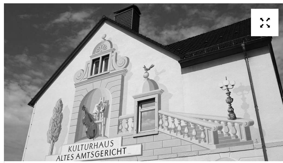
Die frühere Nutzung ist noch im Namen enthalten, doch heute wird an der Darmstädter Straße gelernt und musiziert und nicht mehr Recht gesprochen. © p