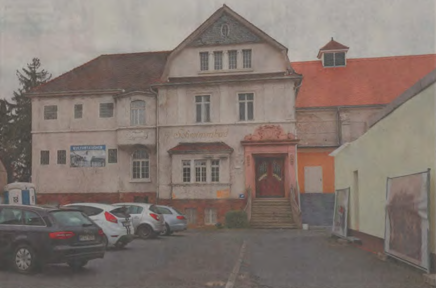
assade des Alten Hallenbads in Friedberg, das inzwischen eine Kulturstätte ist, soll saniert werden.