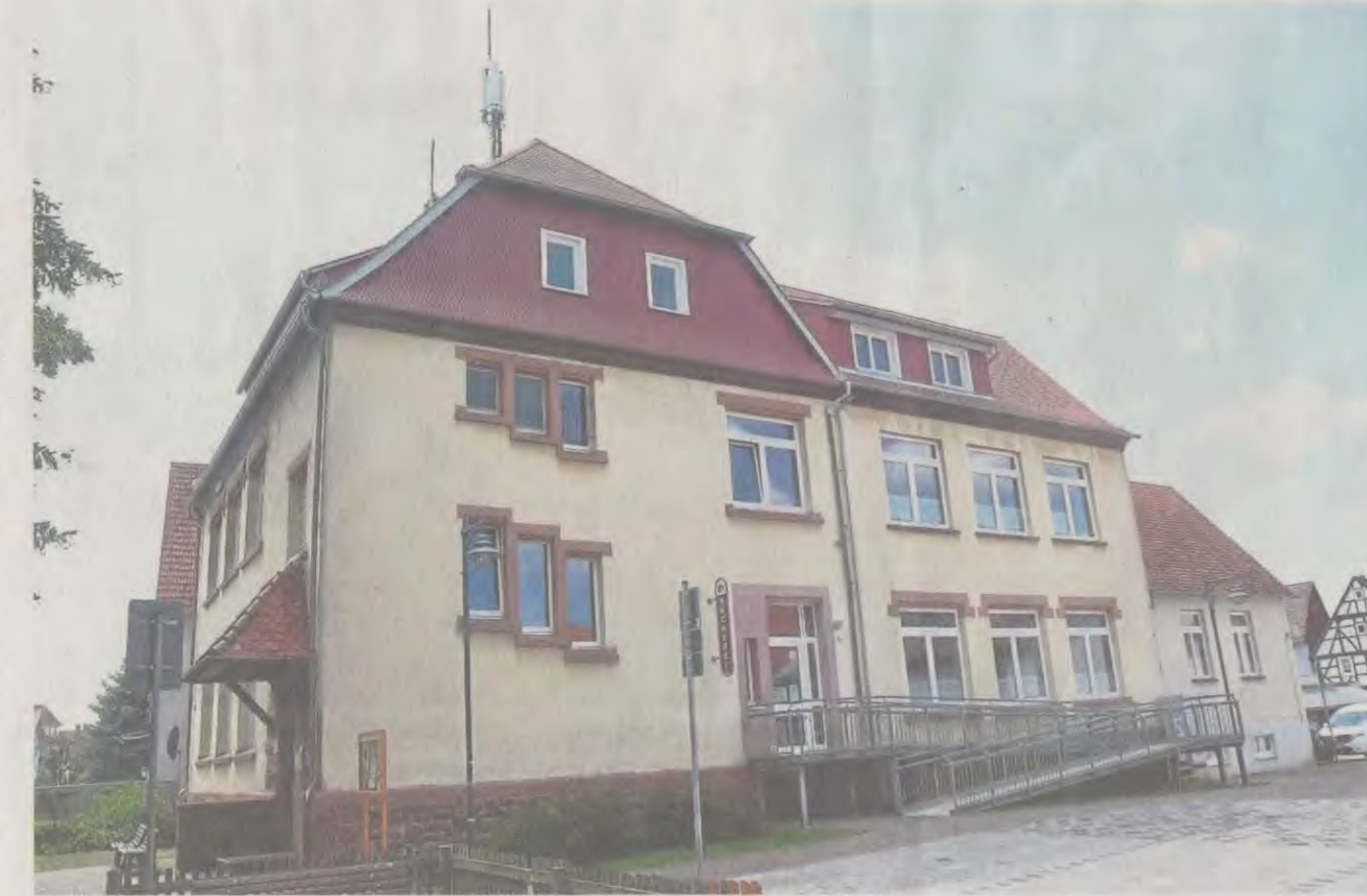
Beständig im Wandel: das Gustav-Schoeltzke-Haus in Alheim. Heute nutzen es auch Vereine.

Das Gustav-Schoeltzke-Haus steht in Altheim in un-