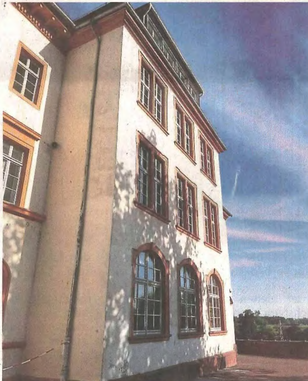
Problemfall HMS: Jetzt sind die Bürger gefragt.