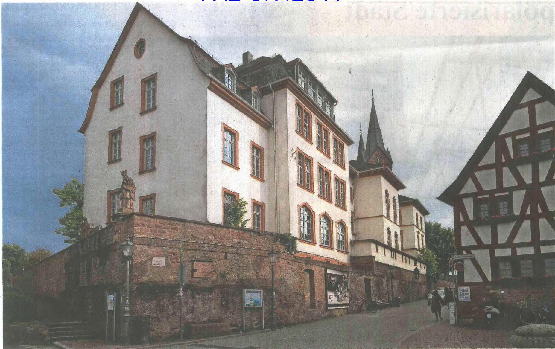
Kulturhaus oder Kindergarten: Über die Zukunft des Schulgebäudes sollen nun die Seligenstädter Bürger entscheiden.