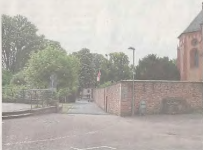
Privatschul-Ansatz: „Die Schulhoffläche reicht nicht aus, die Außenfläche ist als Ergänzung wohl erforderlich.“