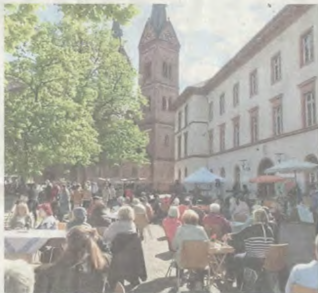
Kulturhaus-Pläne der HMS-Freunde: Muttertagskaffee auf dem Schulhof.

Frühere Hans-Memling-Schule: Alle drei Varianten sind grundsätzlich umsetzbar, sagen die Architekten.