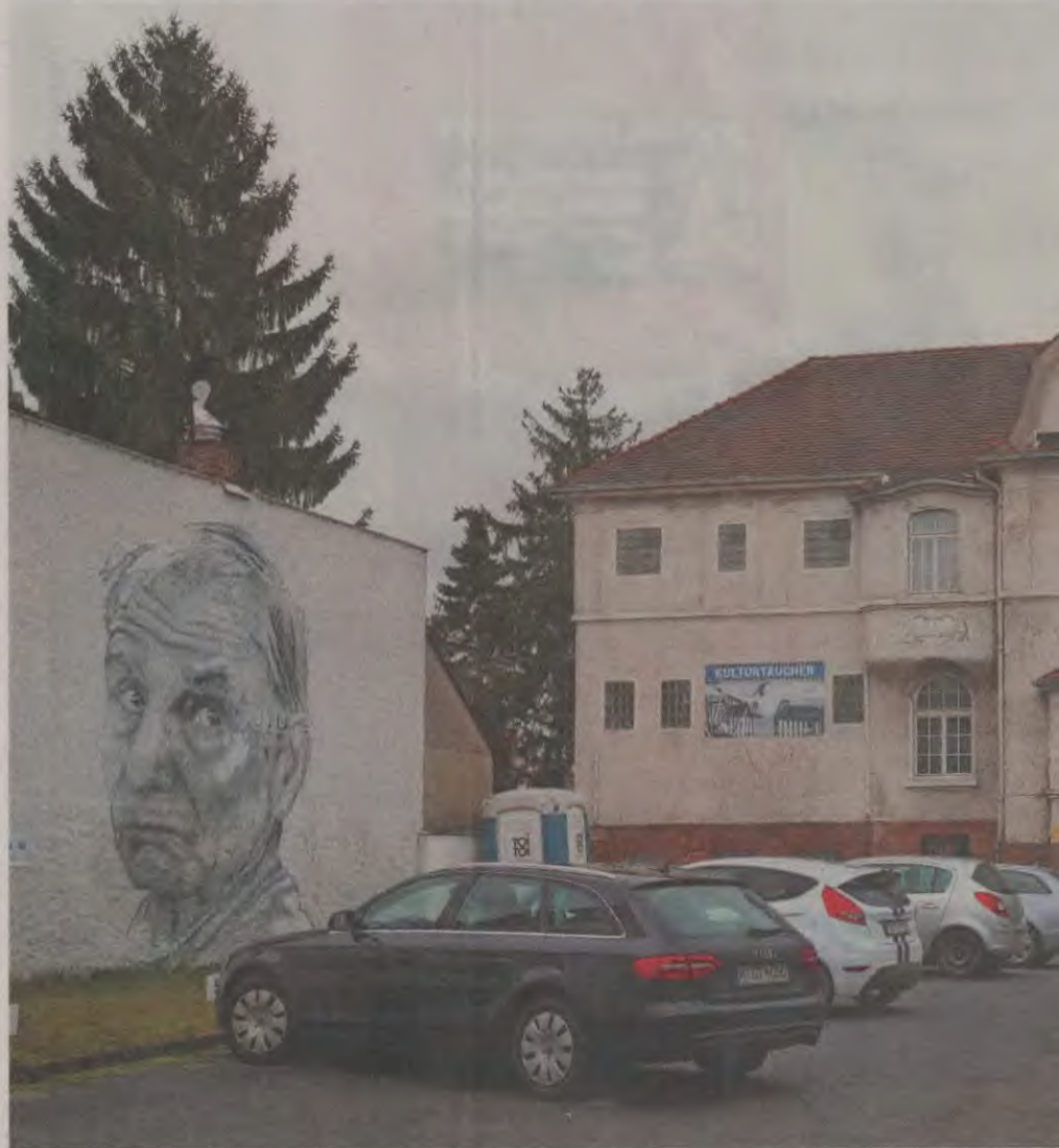
Theater statt Freischwimmer: Auch die Fassade des Alten Hallenbads in Friedberg, das inzwischen