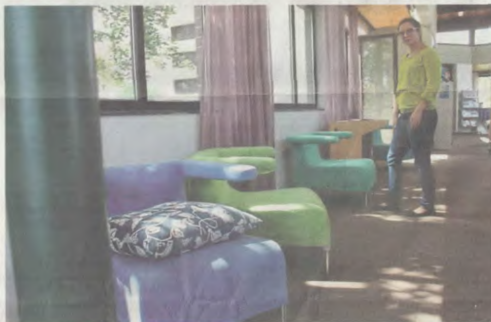
Gebrauchte, aber immer noch ansehnliche Sessel laden die Besucher zum Verweilen in der Bücherei ein.

Da ist zum Beispiel die gemütliche Kuschecke, in die sich die jeweilige Vorleserin und ihre kleinen und größeren Zuhörer beim Bilderbuchkino zurückziehen. Ses-