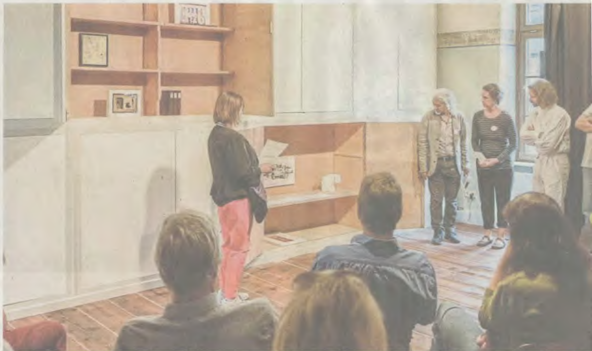
Fast wie beim Adventskalender öffnete sich Tür für Tür der Schrankwand, um mit Werken der ausstellenden Künstler aus Offenbach, Frankfurt und Altheim auf kommende Ereignisse neugierig zu machen.