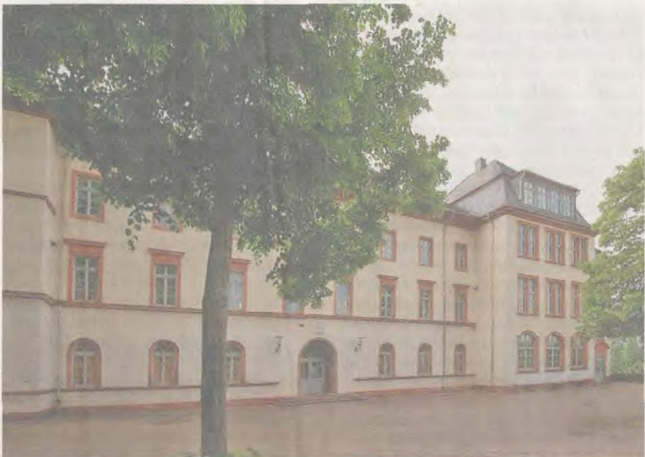
Leerstand: Über die Zukunft der Hans-Memling-Schule wird gestritten.

Der Magistrat legte im Februar einen Bericht über die drei möglichen Nutzung- szenarien vor, ohne sich auf eine Variante festzulegen. Bei einer Voruntersuchung durch ein Architektenbüro wurden die Kosten zum Herrichten des Gebäudes auf rund 5,1 Millionen Euro geschätzt. Die CDU beantragte, unverzüglich mit dem Verein „Freunde der Hans-Memling-Schule“ eine Nutzungsvereinbarung abzuschlie- ßen. Die CDU stellt in Seligenstadt zwar die mit Abstand stärkste Fraktion, verfügt aber nicht mehr über die Mehrheit. Auch über ihren Antrag wird erst nach der Som- merpause entschieden werden.