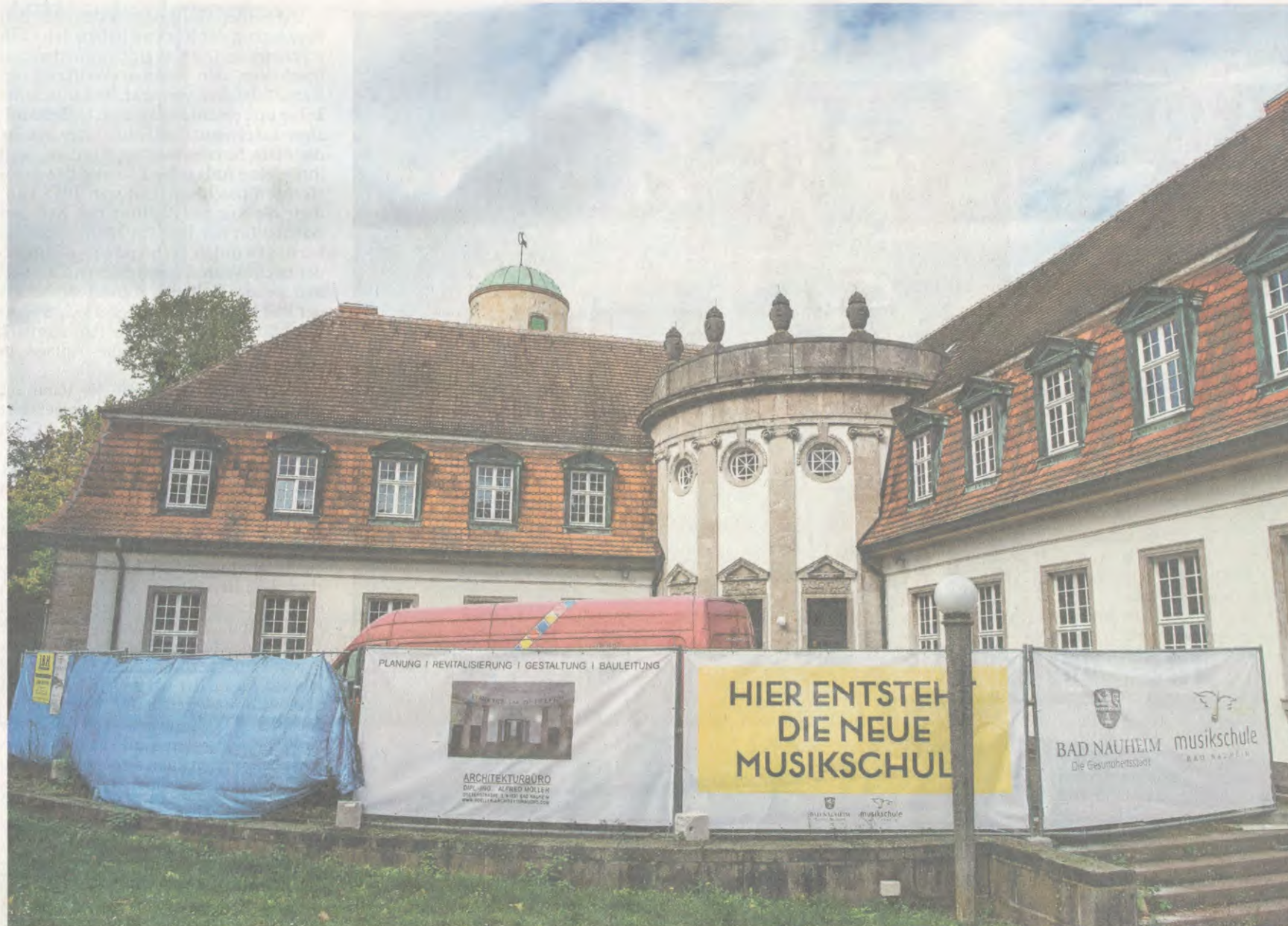
Die Wissenschaftler sind gegangen, die Künstler kommen: Früher wurden im Balneologischen Institut Heilwirkungen untersucht.

Bislang ist die Musikschule gemeinsam mit einer Außenstelle der Stadtschule in der ehemaligen Schule der amerikanischen Streitkräfte an der Rotdornstraße untergebracht. Als die Siedlung für die Familien der Armeeangehörigen im Zuge der Truppenabbaus aufgegeben wurde, richtete der Kreis in der amerikanischen Schule vor gut einem Jahrzehnt eine Dependence für die Grundschüler der Stadt-