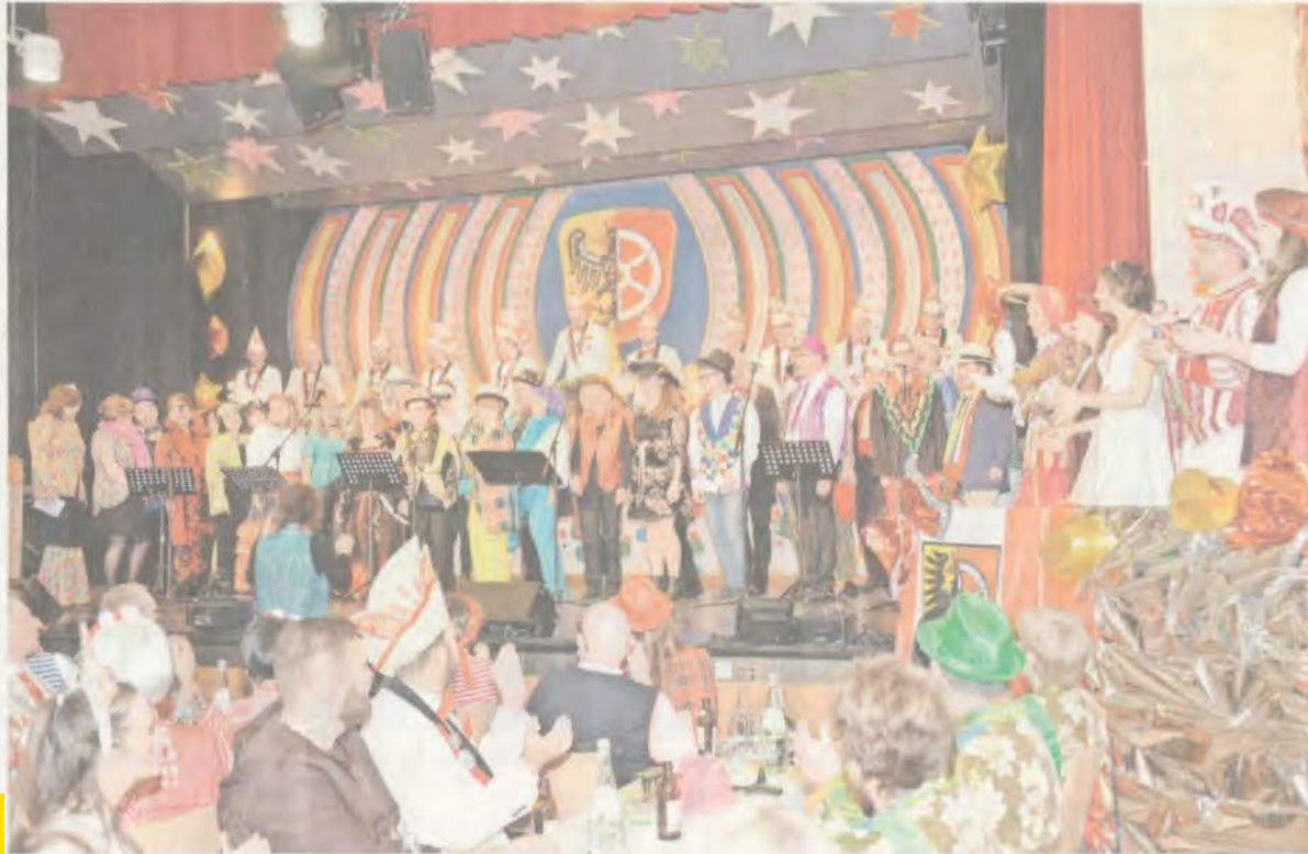
Prinzenhuldigung durch den Germania-Rock-Pop-Jazz-Chor.