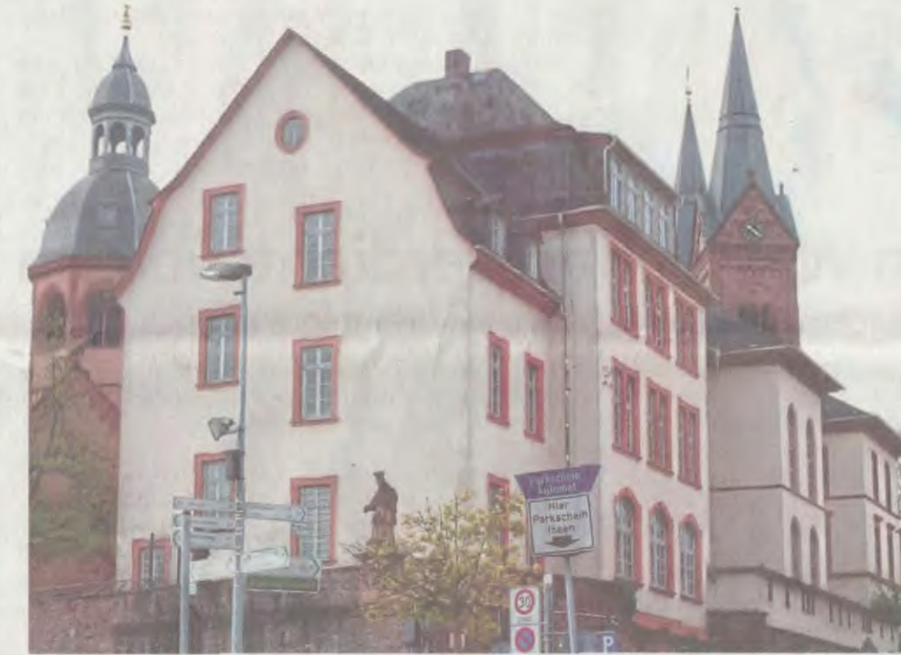
Dauerbrenner Hans-Memling-Schule: Nun soll's „eine repräsentative Befragung aller Wahlberechtigten“ richten.