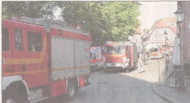
26. Juli: Rauchentwicklung über dem Kloster-Areal ruft die Feuerwehr auf den Plan. Die Entwarnung folgt auf dem Fuß. Die Klosterbäcker hatten ihren Ofen wohl zu tüchtig geschürt...

tur damit nicht S könne. Misstrau Opposition auch Planungsexperte mag gegenüber. Zuletzt verlangt blick in den Vert Stadt und Unter interessierte Öffi bei derart weitre haben ein Recht die Initiative sch ment. Vertragsd heute nicht bek meister Dr. Dani hat frühzeitig se mung zur exterr wicklung zu erke Seine Verwaltung diese Managem