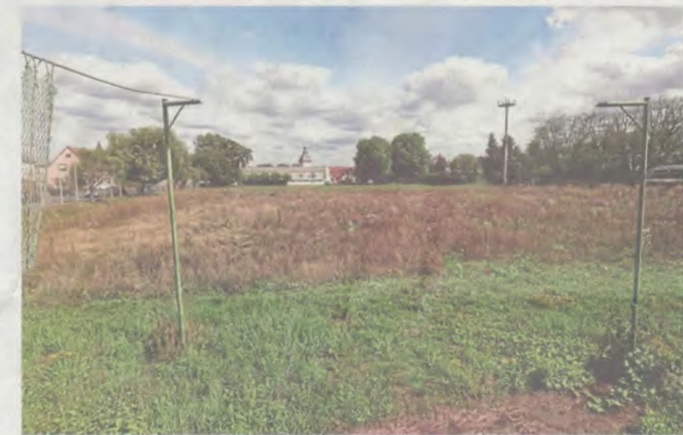
Der Jahnsporplatz und das frühere Gelände der Stadtwerke gehören nach Ansicht der CDU-Fraktion zu den Schandflecken in Seligenstadt.