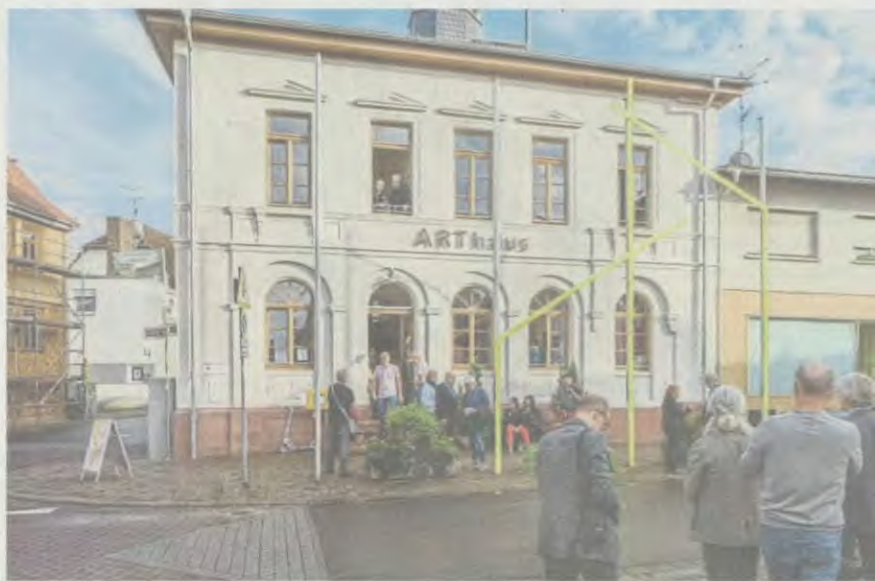
Nach kurzem Schauer kommt die Sonne wieder durch und erste Gäste der Messe kommen auf die Hauptstraße, um den Eröffnungszeremonien beizuwohnen.

Natürlich blieb es nicht beim „Appetit-Holen“ zur Eröffnung. Im Erdgeschoss standen Häppchen und Getränke bereit. Wer wollte, konnte sich anhand der kleinen, aber sehr informativ gehaltenen Kataloge einen