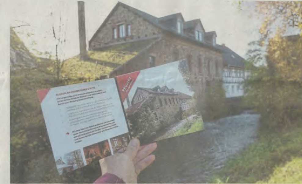
Mit einem quadratisch-praktisch gefalteten Flugblatt will Münster noble Spender werben, etwa für den Ankauf der Langmühle.

Drei Projekte sind es, die der Kommune laut Flyer besonders am Herzen liegen. Das Kulturprogramm, für das Sponsoren mit einer Förderer-Plakette „Realisiert mit Unterstützung von ...“ gelockt werden sollen, der Kauf der Langmühle, zu dem edle Spender als „Kulturförderer“ oder „Kulturunterstützer“ auf allem Gedruckten zur Mühle und dem darin untergebrachten Museum genannt werden sollen, sowie das Pro-