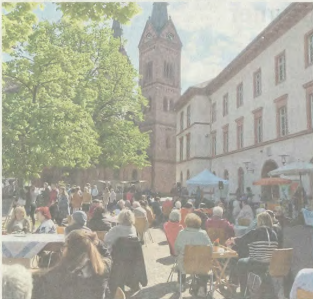
Immer wieder gibt es Veranstaltungen an der ehemaligen Hans-Memling-Schule im Schatten der Einhardbasilika.