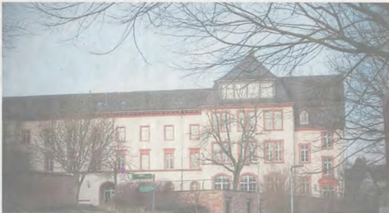
Zankapfel frühere Hans-Memling-Schule: Der Dornröschenschlaf hält an.