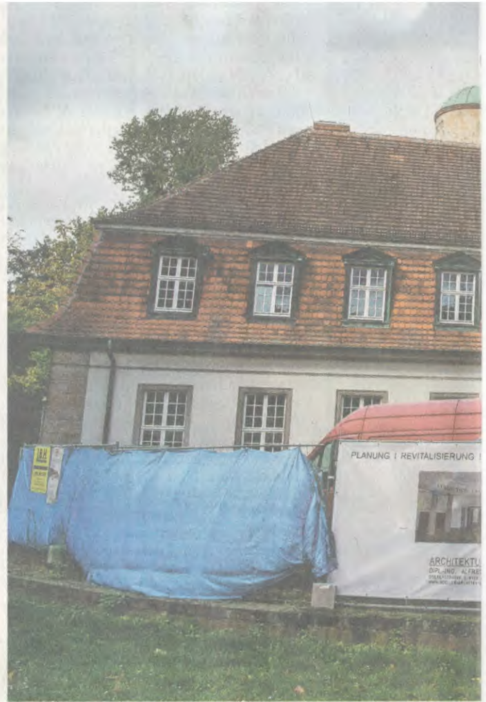
Die Wissenschaftler sind gegangen, die Künstler kommen: Früh

Nach Prüfen verschiedener in Frage kommender Anwesen fiel die Entscheidung der städtischen Gremien zugunsten des Balneologischen Instituts. Auch die Musikschule selbst befürwortete einen Umzug dorthin. Denn tatsächlich bietet dieses Haus ähnlich viel Platz wie der bis-