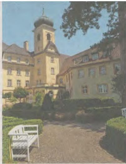
Sanierungsbedürftig: Malteserschloss in Heitersheim

Der Bürgermeister hält es für möglich, dass es noch ein Bürgerbegehren