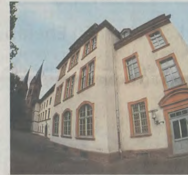
Leerstehende Hans-Memling-Schule: Bürgerbefragung mit zwei oder drei Varianten?