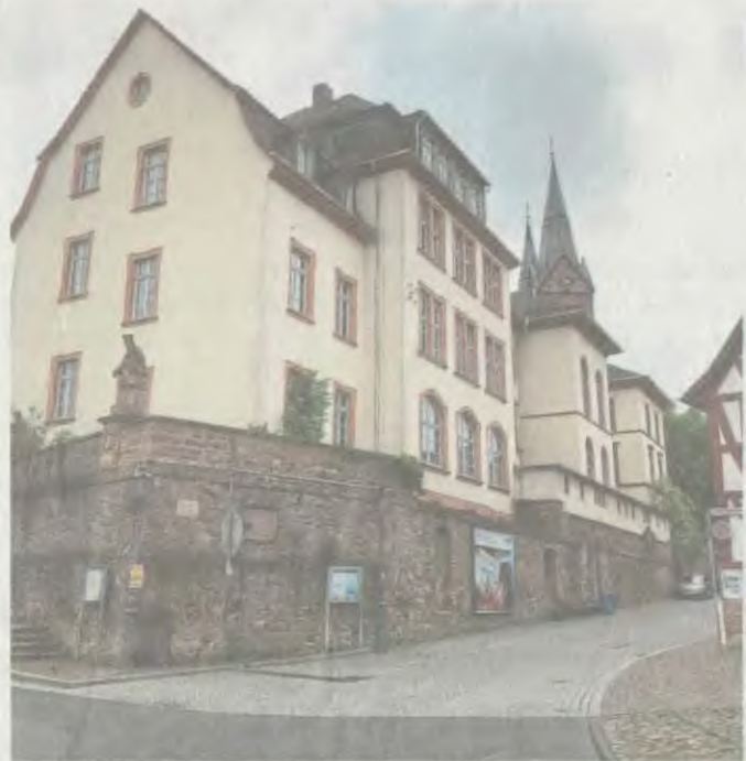
Immer wieder im Blickpunkt von Diskussionen: Die ehemalige Hans-Memling-Schule an der Basilika.

Beide Texte sind online unter www.Freunde-HMS.de verfügbar.