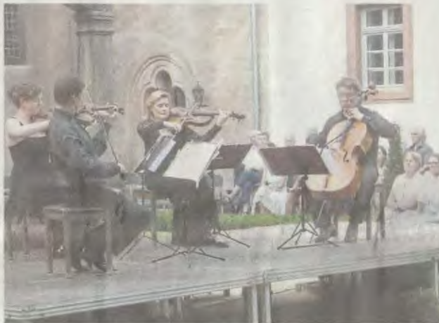
Kleines Streicherfestival mit dem Henschel-Quartett: Entscheider als Kulturbanausen?

Behandelt ausgerechnet die Kultur- und Geschichtsstadt Seligenstadt diese weichen Standortfaktoren stiefmütterlich? Ja, sagt Preuschoff im Brustton der Überzeugung, hat gleich Beispiele parat. So sei der Kultur-Button auf den Homepages vieler vergleichbarer Städte an prominenter Stelle angebracht, zumeist auf der Startseite, während man sich auf www.seligenstadt.de trotz hochklassiger Veranstaltungen