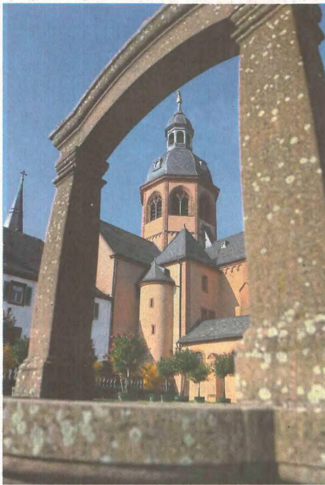
Die Einhardbasilika als Wahrzeichen Seligenstadts ist nur eines der Bauwerke, die am Sonntag im Blickpunkt stehen.

> Mit der Pfarrkirche St. Marien steht ein weiteres Gotteshaus für seine Gäste offen. Nach den beiden Gottesdiensten um 8 und 11 Uhr laden die Verantwortlichen der Kirchengemeinde zu Führungen in und an der Kir-