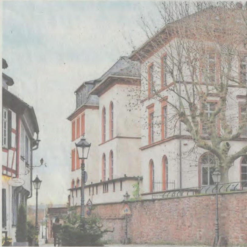
Vor Jahren heftig umkämpft, seither dem Verfall preisgegeben: die ehemalige Hans-Memling-Schule.

Seither hat sich am und im Gebäude nichts, rundum aber einiges bewegt. 2016 übernahm ein Bündnis aus SPD, FDP und Freien Wählern das Ruder im Stadtpar-