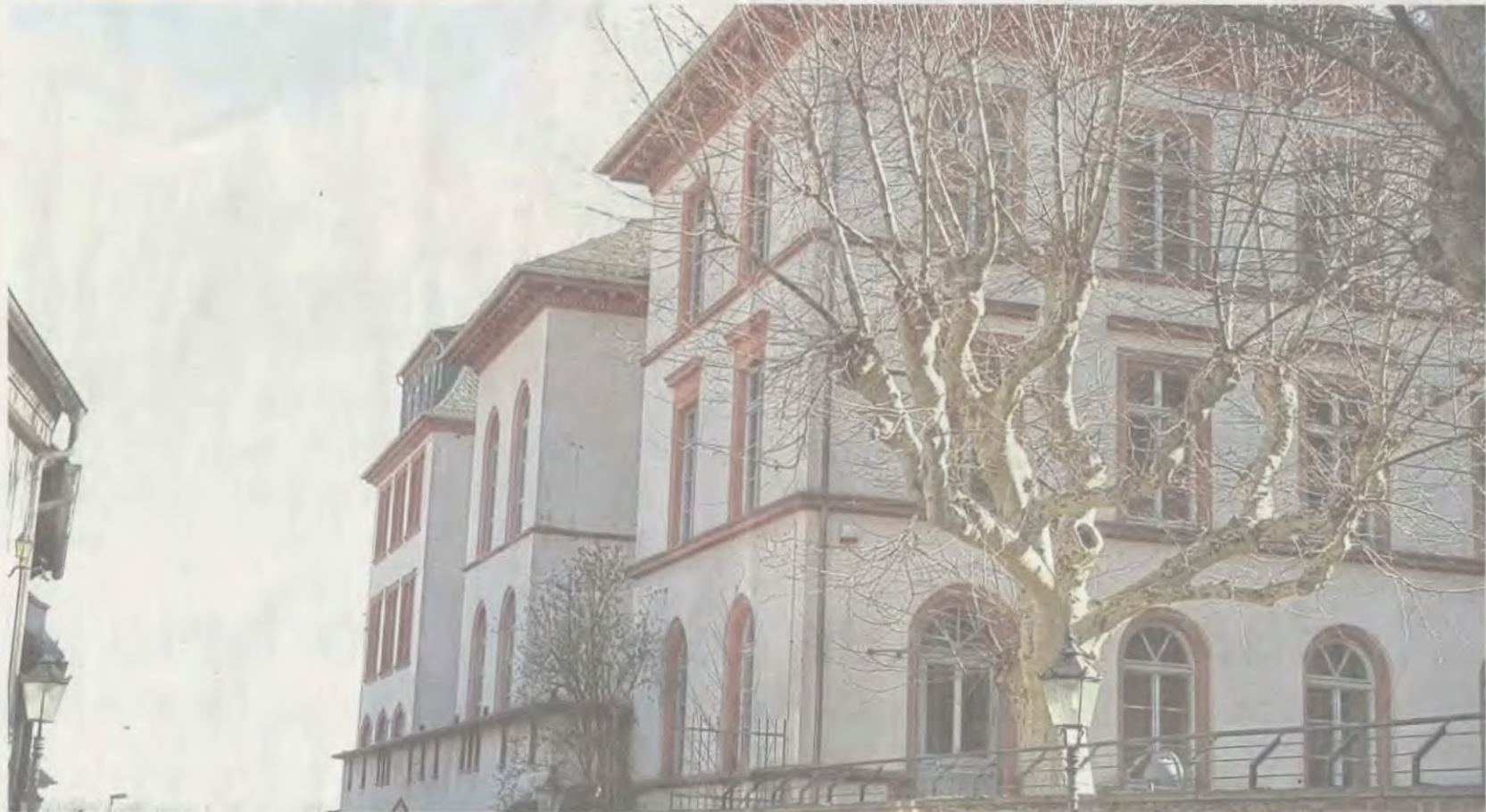
Frühere Hans-Memling-Schule: Alle drei Varianten sind grundsätzlich umsetzbar, sagen die Architekten.

Seligenstadt – Auf einen Beschluss zur Einrichtung eines Kulturzentrums im leer stehenden Gebäude der früheren Hans-Memling-Schule (HMS; 2012) folgten über Jahre hinweg endlose Diskussionen, Streitereien, mehrere Schadensgutachten, Anfeindungen, eine eigene Vereinsgründung, Unterschriftenlisten, Nutzungen, Nutzungsverbote und -einschränkungen sowie – zuletzt – schier endlose Fachausschuss-Hearings zu den Prüfungsergebnissen der inzwischen drei