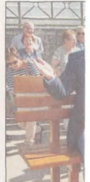
20. September: Schwisterung). Zehn Jahre Part