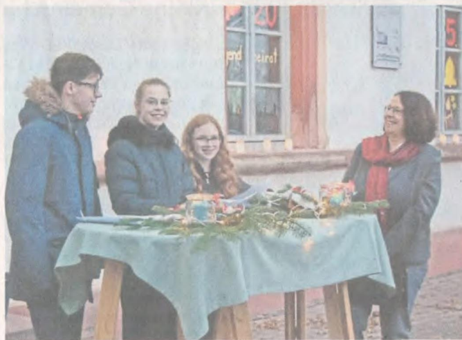
HMS-Adventsaktion: 23 Paten, 180 Akteure.

Für die gebastelten Fensterbilder gab es manch bunte Gestaltungsidee. Der vollständige Kalender an der Fassade des Gebäudes wurde täglich mehr zu einem wunderschönen Anblick. Neben viel Kerzenschein wurden Lebkuchen, Plätzchen, Dönerpizza, Glühwein, Punsch und sogar Whisky spendiert.