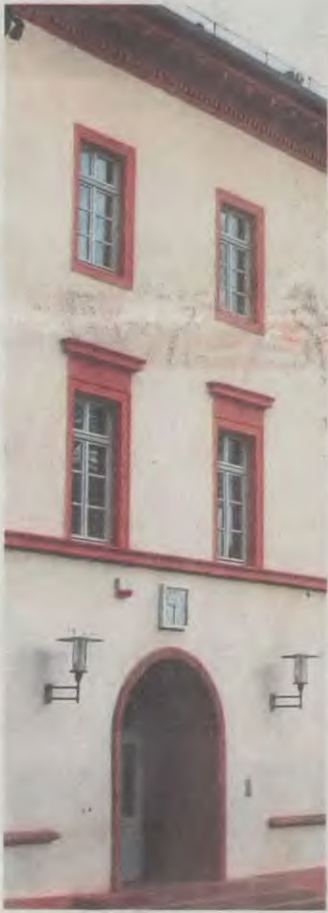
Hans-Memling-Schule: Ganz normaler Wahnsinn.

Am Sitzungs-Montag fanden die inzwischen hinlänglich bekannten Aufführungen des ganz normalen HMS-Wahnsinns vor spärlichem Zuschauerinteresse ihre Fortsetzung. So lehnte die Koalitionsmehrheit aus SPD, FDP und FWS einen Grünen-An-