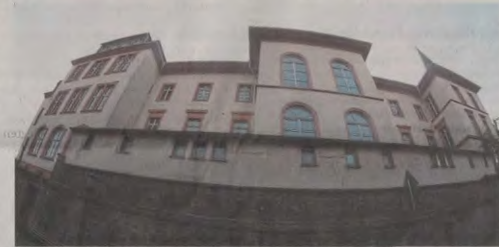
Die Varianten zur zukünftigen Nutzung der ehemaligen Hans-Memling-Schule stehen in der nächsten Stadtverordnetensitzung erneut zur Diskussion.

Wir mehrfach berichtet, liegen dem Magistrat seit März 2018 drei Nutzungsvarianten für den seit Jahren leer stehenden Gebäudekomplex vor. Nach anfänglichen Plänen, die eigene Verwaltung mit der Aufgabe zu betrauen, entschied sich Bastian Ende Juni 2018 dafür, externe Gutachter (Architekten) zu beauftragen. Diese haben die Vorschläge inzwischen auf zahlreiche Aspekte hin untersucht. Nach Angaben Bastians hat in den vergangenen Monaten ein intensiver Austausch zwischen dem Bauamt und den externen Fachleuten stattgefunden. Je nach Variante, so der Rathauschef weiter, sei beim HMS-Gebäudekomplex von